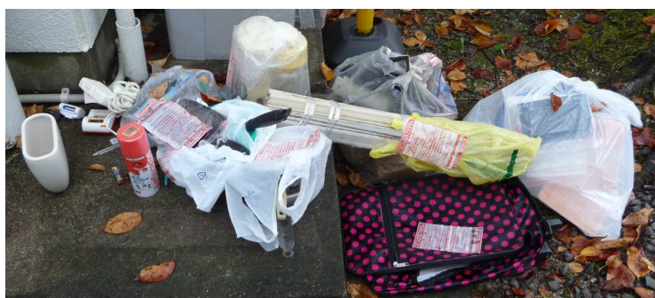
自治会館に集められた大型ごみと無分別のゴミ

しかし、今だに、 分別できていないゴミ や、 大型ごみ を捨てる方がおられるようです。収集されないでいつまでも置かれたままになるのもよくないので、環境保全部長さんのご好意で、巡回しながら、一旦、自治会館に集め、まとめてリレーセンターに持って行ってくださっています。