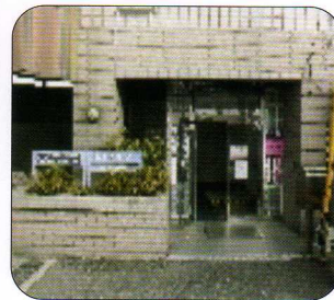
セラビーいこま メディカル棟入り口