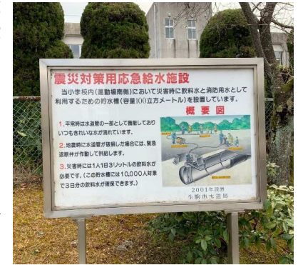
生駒東小学校正門沿いの掲示板

なお、大震災発生直後に水道局職員が駆けつけてポンプを操作することができない場合には、住民自ら貯水槽の給水口に手動式ポンプをとりつけて給水をおこなってください。ただし、貴重な水なので近くにあるからといって、優先使用できるということではありません。