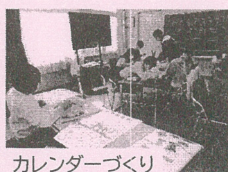
カレンダーづくり

11月22日 は、まもなくお正月を迎えるので、「 年賀状づくり 」をしました。色鉛筆やサインペン、シールを張り付けたりしながら、個性豊かな年賀状ができました。