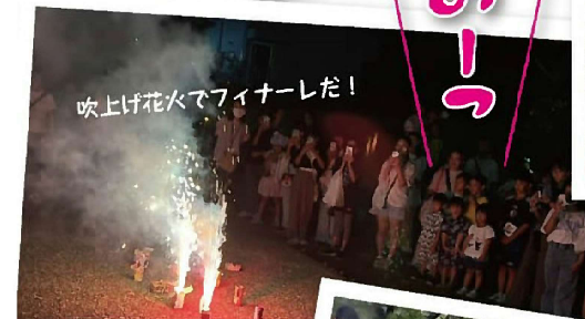
吹上げ花火でフィナーレだ!