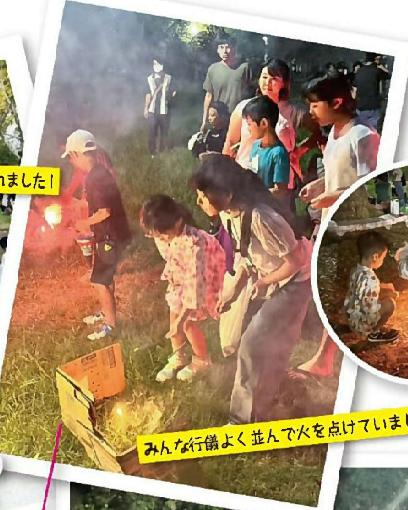
みんな行儀よく並んで火を点けていました!