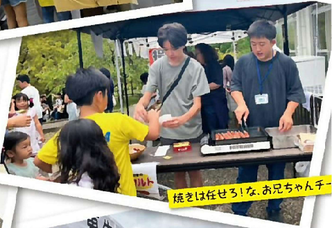
焼きは任せろ!な、お兄ちゃん